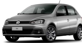
Plata Tungsteno (Metálico)