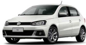
Blanco Cristal (Sólido)