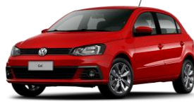
Rojo Flash (Sólido)