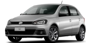
Plata Sirius (Metálico)