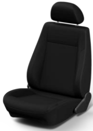
Negro Disponible en versión Trendline