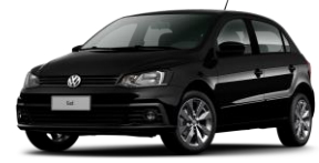
Negro Ninja (Sólido)