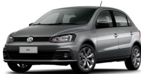
Gris Platino (Metálico)