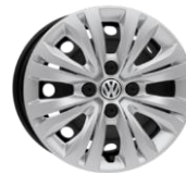
Rines de acero con embellecedores Disponible en versión Trendline de 14"