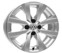
Diseño 'Fenix' Disponible en versión Comfortline de 15"

Comentarios: El equipamiento mencionado en el presente documento corresponde a la información disponible al momento de la impresión. Imagen solamente ilustrativa. El importador se reserva el derecho de realizar cambios sin previo aviso. El importador no será responsable de errores tipográficos. Antes de firmar un contrato, por favor solicite más información sobre el equipamiento de serie y equipos opcionales a su concesionario. La ficha técnica es válida desde el 1 de Marzo 2018. Todos los vehículos incluyen 2 años de garantía sin límite de kilometraje contada a partir de la fecha de entrega registrada en el Manual de Mantenimiento y Garantía Volkswagen. La Línea de asistencia Volkswagen (ANDI Asistencia) es 18000919713 a nivel nacional y 6463222 para Bogotá.